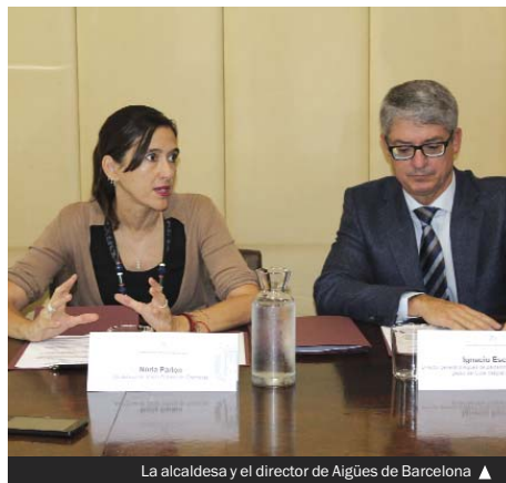
La alcaldesa y el director de Aigües de Barcelona ▶

En todos los casos, el Ayuntamiento, a través de la OMIC o de los Servicios Sociales, ha orientado y asesorado a los vecinos y vecinas. En conjunto, se ha conseguido que ninguna familia colomense sufriera cortes de este suministro.