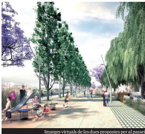
Imatges virtuals de les dues propostes per al passeig: a l'esquerra la 1, a tocar del riu, i a la dreta la 2, a tocar dels edificis. ▶

El primer projecte preveia construir un passeig a la vorera del riu, ampliant la franja de pas i implantant alguns elements per afavorir l'oci com, per exemple, zones de jocs infantils. Es tractava de fer un gran