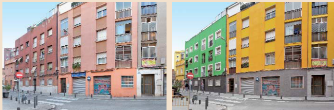
La calle, antes y después de la reforma ▲

Este fin de semana se celebra la fiesta popular del Fondo de Dalt (Fondo Alto) y, entre las diversas actividades previstas, destaca por su singularidad la entrega de flores a las comunidades de vecinos de la calle dels Pirineus (sábado 15 de julio, a las 18.30 h), que han rehabilitado sus edificios en los últimos meses, contribuyendo a la renovación y embellecimiento de la zona.