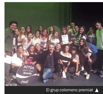
El grup colomenc premiat ▶

En la composició del jurat hi havia personalitats destacades com l'actor de la sèrie Merlí , Pere Ponce. En la passada edició, l'Institut Ramon Berenguer IV ja va rebre el premi al millor espectacle pel seu valor pedagògic, fet que situa l'Institut colomenc a un referent i representa un gran estímul per seguir treballant com a únic centre de batxillerat escènic de Santa Coloma de Gramenet.