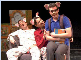
Lloc: Teatre Sagarra (c. Lluís Companys, 27) Informació: www.teatresagarra.cat

Diumenge, dia 26 (12.00), un clàssic de la narrativa infantil treu el cap a la programació del teatre familiar: Els tres porquets , de la Cia. Magatzem d'Arts. Un bon dia, l'empresa on treballava el pare dels porquets tanca la filial i l'obliga a marxar tot sol a Metropòrkolis. És llavors quan els tres german s'hauran d'espavilar i construir-se una casa des de zero. Les desavinences faran que cadascú se'n faci la seva segons un criteri particular, i les tres construccions seran posades a prova pel temible llop ferotge. Preu: 8 € (descomptes habituals).