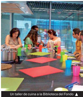
Un taller de cuina a la Biblioteca del Fondo ▲

La Biblioteca Central, la més antiga, continua encapçalant el rànquing de visites (135.684), seguida per Can Peixauet (100.944). Precisament per ser la més veterana, la Central té el fons més impor-