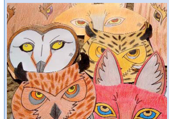
Informació: Facebook d'Ecometròpoli / 618 007 230

La Jugateca Ambiental és un espai familiar i d'oci, situada al parc de Can Zam, amb jocs, tallers i itineraris gratuïts. Funciona els caps de setmana al matí dins del programa de primavera del Centre d'Educació Ecometròpoli. Diumenge, dia 26 (11.30), la Jugateca s'estrena aquesta temporada amb un taller de Carnestoltes. Hi podreu fer les vostres disfresses amb materials reciclats o pintar una màscara salvatge d'algun animal de la serra de Marina. Aquestes activitats són gratuïtes i per a tots els públics.