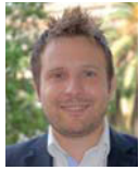
Dimas Gragera Portaveu del Grup Municipal Ciudadans