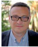
Esteve Serrano Portaveu del Grup Municipal Socialista