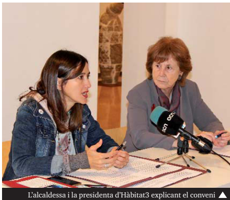
L'alcaldesa i la presidenta d'Hàbitat3 explicant el conveni ▶

En els últims anys hi ha hagut un increment de processos judicials d'execució hipotecària i de desnonaments arreu del país. Les dificultats d'inserció en el món labo-