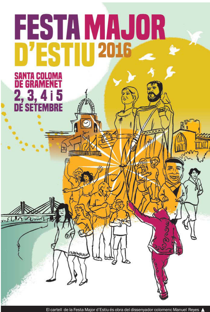
El cartel de la Festa Major d'Estiu és obra del dissenyador colomenc Manuel Reyes ▲