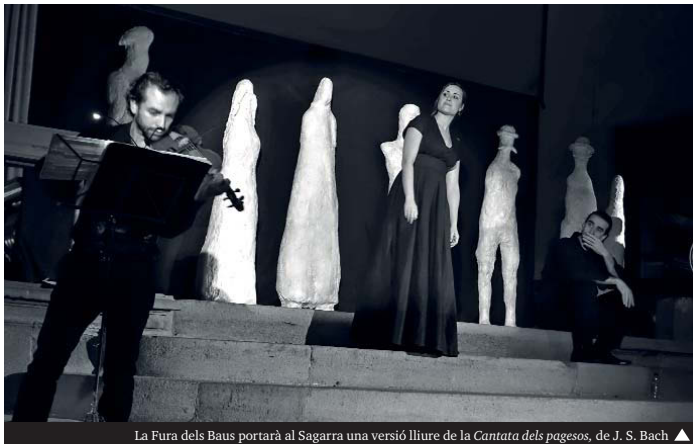
La Fura dels Baus portarà al Sagarra una versió lliure de la Cantata dels pagesos , de J. S. Bach ▶

Estrelles com Josep M. Flotats, Alberto San Juan, Clara Segura o Tricycle, que van portar els seus espectacles a Santa Coloma, han contribuït a l'èxit del Teatre. Durant el primer semestre d'enguany, quinze obres —tres de dansa— van completar una programació estable, on va haver-hi un regal tan impactant com El llarg dinar de Nadal , Premi Butaca al Millor Espectacle de Petit Format. A tot això, cal afegir unes 130 ocupacions —altres programacions, sessions a entitats i assajos— per tenir una panoràmica completa de l'activitat de la sala. Fruit