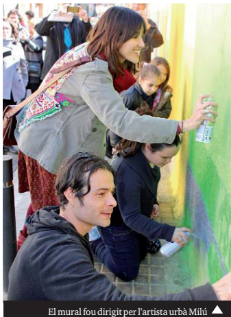
El mural fou dirigit per l'artista urbà Milú

En menys de dos anys, s'ha previst l'actualització d'un total de 32 edificis d'aquest carrer (26 de plurifamiliars i 6 d'unifamiliars), que sumen 360 habitatges i 26 locals; se'n beneficiaran 649 propietaris i propietàries. Són edificis amb una mitjana de 41-45 anys d'antiguitat als quals se'ls farà el condicionament i la pintura de façanes, cobertes, patis interiors. En la majoria de casos, s'hi millorarà la qualitat i l'aïllament