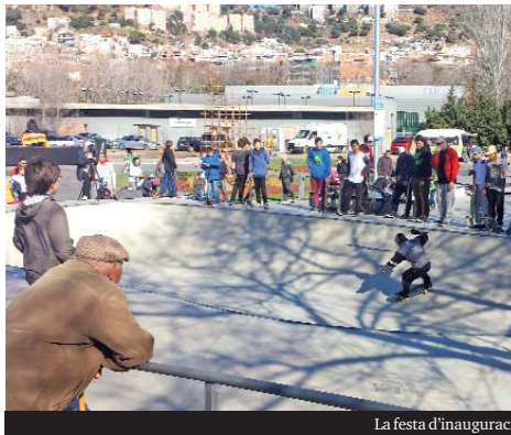
La festa d'inauguració del nou skate de Can Zam, celebrada el cap de setmana passat, va tenir un gra exit de públic ▶

La intervenció ha consistit en la plantació de gespa, zona arbustiva i arbres, i la creació d'un nou accés i una zona de pas al parc en forma de ziga-zaga que permet la comunicació entre el carrer de Víctor Hugo i l'avinguda de Francesc Macià. També s'ha incorporat al parc un espai de 2.600 metres quadrats, que fins ara ocupava l'antic carrer de Girona, i s'ha habilitat un pas directe per als vianants al lateral, fet que connecta el parc amb l'estació Can Zam de la L9. Durant dos mesos, les persones usuàries veuran que hi ha tanques transparents per protegir la zona, les quals hi romandran fins que arribi la plantació.