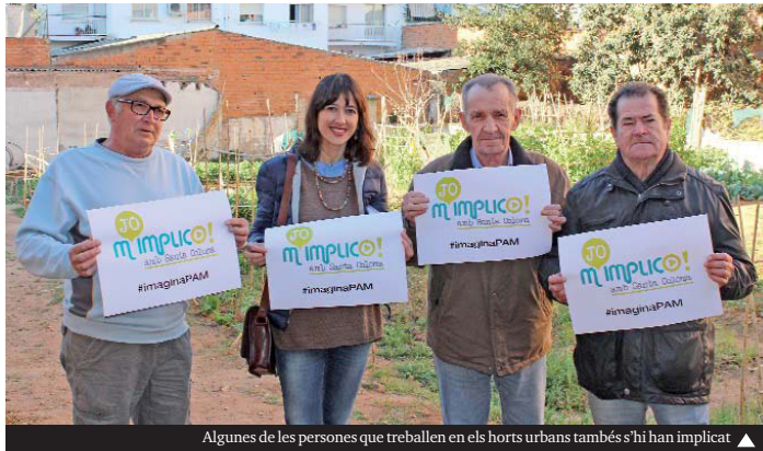
Algunes de les persones que treballen en els horts urbans també s'hi han implicat ▶

Un altre objectiu és que les accions de participació del nou PAM tinguin un vessant lúdic per atreure tot tipus de públic, inclòs el familiar, i en siguin un motiu més de convivència. En aquest sentit, l'alcalde va explicar que el programa d'activitats s'ha publicat en forma de llibret o «passaport» per convidar la ciutadania a un petit joc i fomentar-ne la implicació. Cada cop que un/a ciutadà/na assisteixi a una de les activitats programades en el Passaport