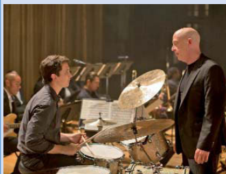
Lugar: Biblioteca Singuerlín - Salvador Cabré (pl. de la Sagrada Família, s/n)

El Cine Club Imatges projecta hoy viernes (20.00), Whiplash , una película de Damien Chazelle que causó gran impacto en el público la temporada pasada. El objetivo de Andrew Neiman, un joven y ambicioso baterista de jazz, es triunfar en el elitista Conservatorio de Música de la Costa Este. Marcado por el fracaso de la carrera literaria de su padre, Andrew se acabará enfrentando a Terence Fletcher, un profesor conocido por su talento y por sus rigurosos métodos. Entrada gratuita.