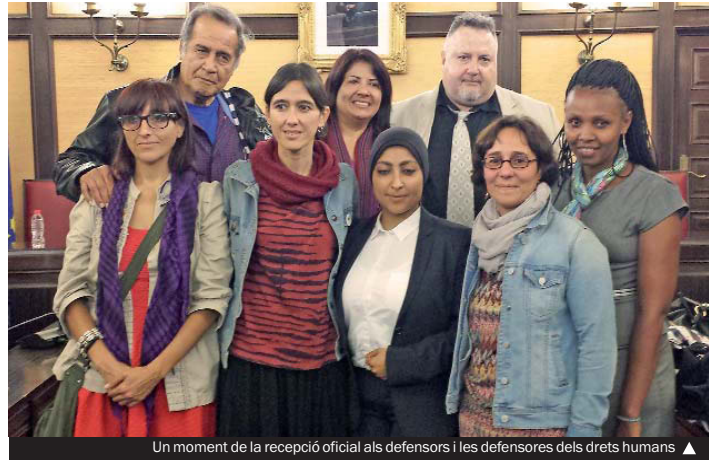
Un moment de la recepció oficial als defensors i les defensores dels drets humans ▲

Fins al 10 d'octubre, aquests sis activistes pels drets humans visitaran catorze municipis barcelonins per donar a conèixer la tasca que fan als seus llocs d'origen per