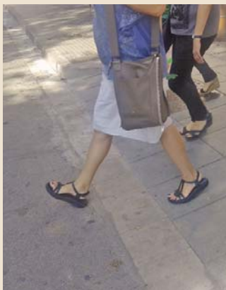
ciudad disponen de pasos de estas características

► Una quincena de passos adaptats a las personas con movilidad reducida están habilitados desde este verano en la calle de Mossèn Jacint Verdaguer. Se han puesto cuatro pasos en la intersección con la avenida de la Generalitat, cuatro más en la conexión con la avenida de Santa Coloma, tres en Magalhaes, y cuatro en la unión de Jacint Verdaguer con Doctor Pagès. En los próximos meses también se habilitarán pasos en las esquinas de Jacint Verdaguer con Irlanda. Como en otras calles de Santa Coloma, estas intervenciones se realizan para facilitar los desplazamientos de aquellos y aquellas colomenses que van en silla de ruedas, las personas que van cargadas con el carrito de la compra o llevan cochecitos de bebés, entre otras. Actualmente, el 90% de las calles de la