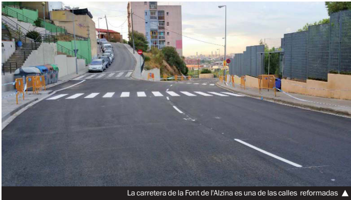
La carretera de la Font de l'Alzina es una de las calles reformadas ▲