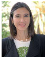
Núria Parlon Gil Alcaldessa de Santa Coloma de Gramenet

Quatre dies de setembre que ens regalaran alegria, bon humor, diversió i ganes de passar-ho bé. Trieu el vostre espai i la millor companyia. Viure la Festa junts, a Santa Colom, és la millor manera de retrobar-nos un final d'estiu més a la ciutat. Gaudim-la!