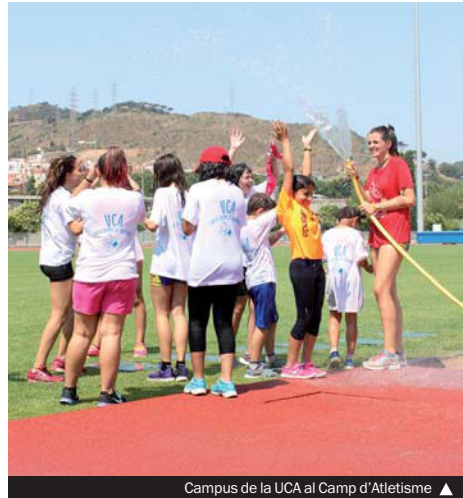
Campus de la UCA al Camp d'Atletisme

Santa Coloma és una de les poques ciutats que dona cobertura d'activitats d'estiu als adolescents