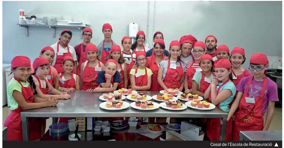
Casal de l'Escola de Restauració

Dilluns, 29 de juny, un total de 2.466 infants i joves van començar els casals i els campus d'estiu que organitza l'Ajuntament de Santa Coloma de Gramenet a vuit escoles de primària, a l'Escola de Restauració, als quatre centres oberts i als equipaments municipals i esportius de la ciutat. Enguany, com va passar l'any passat, les famílies que ho necessitin disposaran a l'agost d'una oferta de lleure al Casal dels Infants i al Centre Obert Rialles. Aquestes dues propostes inclouen un servei de menjador.