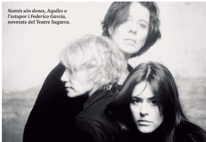
Només són dones, Aquiles o l'estupor i Federico García, novetats del Teatre Sagarra.