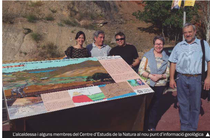
L'alcaldessa i alguns membres del Centre d'Estudis de la Natura al nou punt d'informació geològica ▲

La creació d'aquest espai educatiu dedicat a la geologia colomenca ha estat possible gràcies a la tasca que va realit-