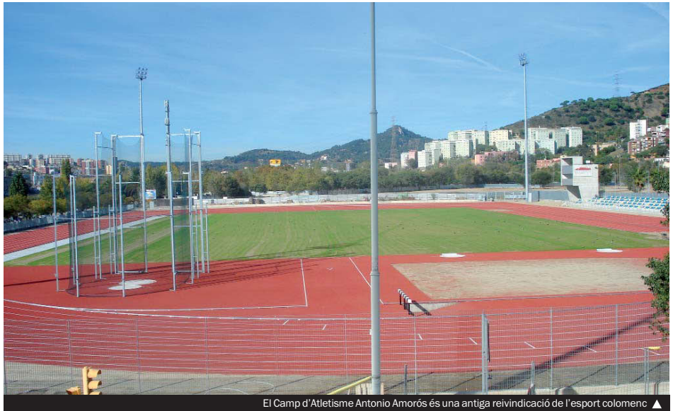
El Camp d'Atletisme Antonio Amorós és una antiga reivindicació de l'esport colomenc. ▶