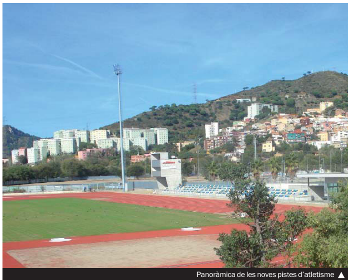
Panoràmica de les noves pistes d'atletisme ▶

Aquest equipament portarà el nom d'Antonio Amorós, la figura cabdal de l'atletisme colomenc que va ser conegut com el Galgo de Caudete en homenatge a la localitat d'Albacete on va néixer. La seva trajectòria esportiva es va desenvolupar principalment a Catalunya.