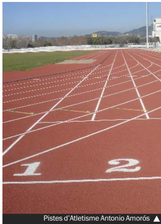
Pistes d'Atletisme Antonio Amorós ▲

► L'Oficina Local d'Habitatge (OLH) té obert el procés de sol·licituds d'adjudicació de 21 habitatges de lloguer, amb opció de compra, situats al carrer del Doctor Ferran (17), a l'avinguda dels Banús (2), a la plaça de les Cultures (1) i a l'avinguda de Santa Rosa (1). Les persones interessades poden demanar més informació els dilluns i els dimecres (de 9.00 a 17.00) i els dimarts, els dijous i els divendres (de 9.00 a 14.00) a l'avinguda de la Generalitat, 112-114, a www.gramepark.cat i al 93 392 47 45.