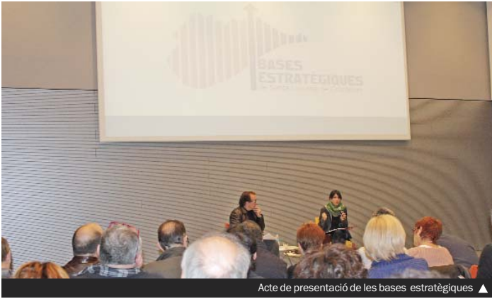
Acte de presentació de les bases estratègiques ▲