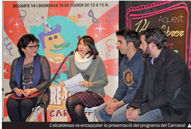
L'alcaldesa va encapçalar la presentació del programa del Carnaval

Les comparses representen entitats i col·lectius colomencs molt diversos. La concentració està prevista a les 17.30 hores de demà, dia 14, a la plaça del Rellotge (la sortida serà mitja hora més tard). Aquesta corrua boja i multicolor marxarà pels carrers de Mn. Jacint Verdaguer i Sant Just, tancarà per l'avinguda de la Generalitat i acabarà a la plaça de la Vila (20.00), on Sa Majestat Carnestoltes, fidel a la tradició, llegirà el pregó i lliurarà els premis a la comparsa més artística, a la més original i a la més marxosa. Per amenitzar l'espera a la plaça de la Vila, la Companyia Colomenca de Teatre i Varietats (COCO-TEVA) presentarà alguns esquetxos de l'espectacle jCòme el coco, negro!