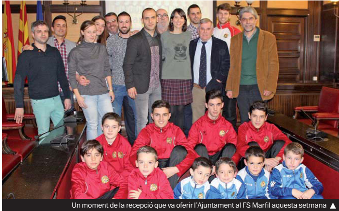
Un moment de la recepció que va oferir l'Ajuntament al FS Marfil aquesta setmana ▲

ció de l'Escola (Can Roig i Torres Clàssics), 19 de l'Escola de Música i l'audició oficial de l'11 de Setembre. En total, van haver-hi 56 concerts, als quals s'han d'afegir 47 cessions de l'equipament a entitats colomenques perquè hi fessin tota mena d'actes culturals.