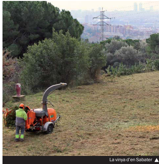
La vinya d'en Sabater ▶

En una segona fase, prevista per a les properes setmanes, es portarà a terme el tancament de les parcel·les i