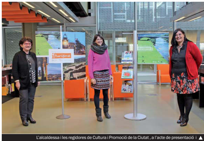
L'alcaldeessa i les regidores de Cultura i Promoció de la Ciutat, a l'acte de presentació i ▲

La qualitat dels espectacles programats i una política de preus realista són els dos ingredients amb què treballa el Teatre per consolidar l'afluència de públic. En aquest sentit, el carnet Sagarra Club, que suposa un descompte del 50%, és atemporal a partir d'ara. Els qui tinguin aquest document només hauran de presentar-lo en taquilla per obtenir l'entrada a la meitat de preu. Les persones que no el tinguin han d'anar a un mínim de tres espectacles i després en gaudiran permanentment, del descompte. El nombre de carnets fets l'any passat va ser de 172.