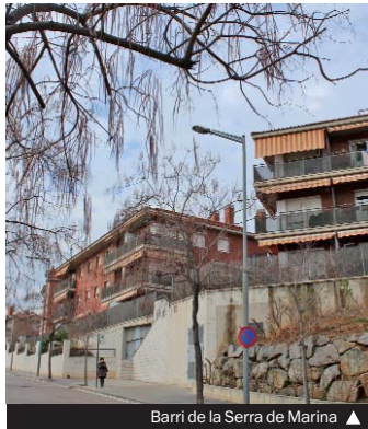
Barri de la Serra de Marina ▲