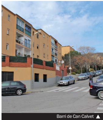
Barri de Can Calvet ▲

Des de dilluns, Santa Coloma passa de tenir 15 barris a tenir-ne 17 ▲