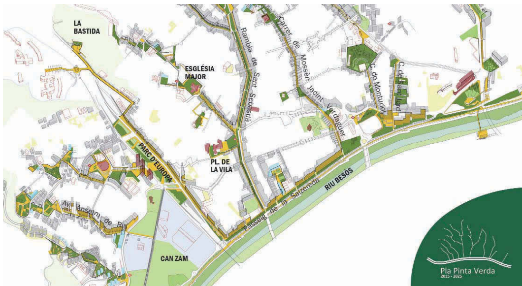
El planol de la ciutat, amb els espais verds i lliures connectats, que preveu el projecte de la Pinta Verda l'any 2025 ▲