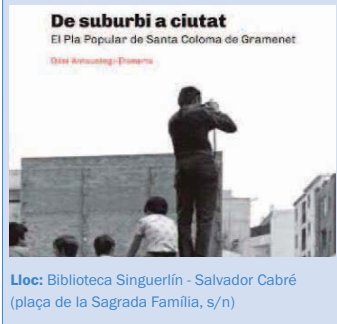
Lloc: Biblioteca Singuerlín - Salvador Cabré (plaça de la Sagrada Família, s/n)