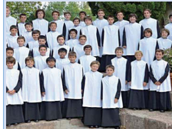
Lloc: església Major de Santa Coloma Organització: església Major

Per commemorar el centenari de la construcció de l'església Major, avui, dia 9 (19.00), tindrà lloc en aquest temple un concert de l'Escolania de Montserrat, el prestigiós cor de nens, que canta a veus blanques, cada dia, al monestir homònim. És una de les institucions musicals més prestigioses i antigues d'Europa. Actualment, l'Escolania està formada per més de cinquanta nens, de nou a catorze anys. Durant els anys que estudien a Montserrat primària i secundària hi fan també els estudis de música.