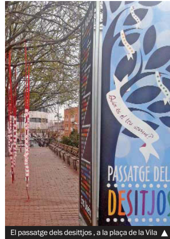
El passatge dels desitjos, a la plaça de la Vila ▲

ció cultural xinesa (dia 27, 18.00). Finalment, l'ACI farà fires als carrers de Sant Jeroni, Major i Anselm Clavé els dies 20 i 27. El trenet de Santa Coloma Tot a Mà i el tió gegant completaran aquesta oferta.