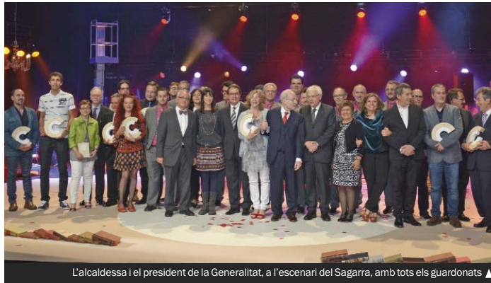
L'alcalde i el president de la Generalitat, a l'escenari del Sagarra, amb tots els guardonats ▲