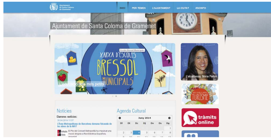
Aspecto del nuevo portal web del Ayuntamiento de Santa Coloma de Gramenet ▲

NUEVOS SERVICIOS Y TRÁMITES El nuevo portal amplía los servicios y trámites a la ciudadanía que serán desplegados por fases. En un primer momento se incorporarán una decena de los trámites más utilizados, y continuar la implementación progresiva de más de un centenar de estos que se pueden realizar en las dependencias municipales. ▶▶ Págs.2