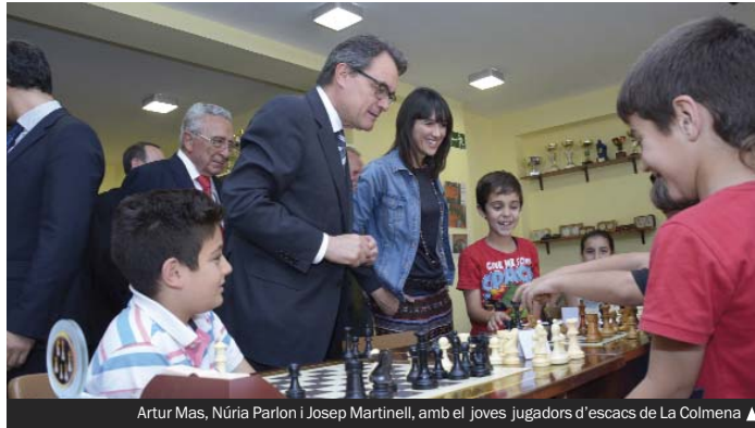
Artur Mas, Núria Parlon i Josep Martinell, amb els joves jugadors d'escacs de La Colmena ▲

L'oficina d'informació de les obres està situada al carrer de la Balldovina, 7. L'horari és de dilluns a dimecres de 16.00 a 18.00 i els divendres de 10.00 a 12.00 hores. Més informació, al 93 462 40 37 (de dilluns a divendres de 9.00 a 13.00 h) i a obrescentre@gramenet.cat .