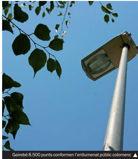
Gairebé 8.500 punts conformen l'enllumenat públic colomenc ▲

L'esforç municipal per revisar i modernitzar l'enllumenat s'ha traduït en diverses inversions que s'han portat a terme recentment. Així, en aquest semestre se n'han fet reparacions per restituir materials malmesos en robatoris en punts com els vials associats al riu, el parc forestal de la Bastida, l'entorn del pont del Molinet o el Bosc Llarg, entre altres. A través de diverses subvencions de la Diputació, també s'han millorat