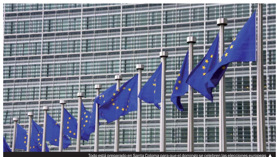
Todo está preparado en Santa Coloma para que el domingo se celebren las elecciones europeas ▶

Desde hace años, el Ayuntamiento ofrece formación a las personas que les ha tocado ser presidente de mesa. La asistencia a estas sesiones —un esfuerzo añadido— es voluntaria; la idea es resolver las dudas que se puedan presentar en la jornada. En todos los centros habrá informadores y, además, se dispone de un servicio de transporte adaptado para las personas que lo necesitan. Para poderlo utilizar, hay que llamar al Servei d'Assumptes Generals (93 462 40 00, extensiones 3056, 2709 y 3068) de 9.00 a 13.00 y de 16.00 a 20.00 h.