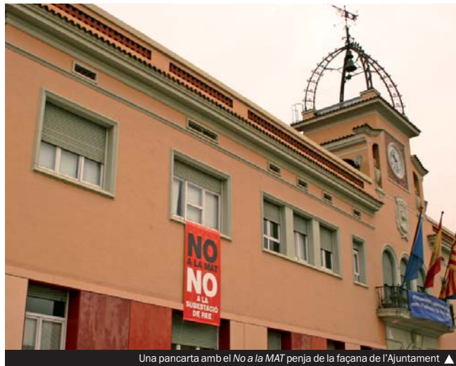
Una pancarta amb el No a la MAT penja de la façana de l'Ajuntament ▶

En el decurs de la reunió, l'alcalde hi va tornar a mostrar l'oposició de l'Ajuntament i de la comissió ciutadana No a la MAT —for-