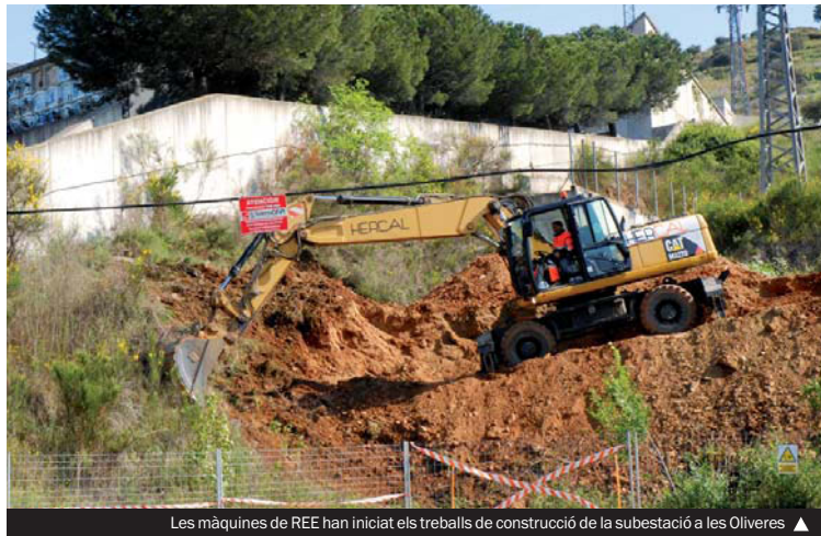
Les màquines de REE han iniciat els treballs de construcció de la subestació a les Oliveres ▶

▶ La Comissió Ciutadana No a la MAT, integrada per la Plataforma per a la Defensa de la Serra de Marina i Can Zam, la Federació d'Associacions de Veïns de Santa Coloma de Gramenet (FAVGRAM) i l'Ajuntament, ha convocat per a avui divendres, 25 d'abril, a les 19.00 hores, una marxa ciutadana de rebuig, davant l'inici de les obres de la subestació transformadora al barri de les Oliveres, prop del Cementiri Municipal.