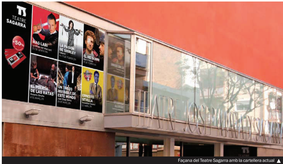
Façana del Teatre Sagarra amb la cartellera actual ▲