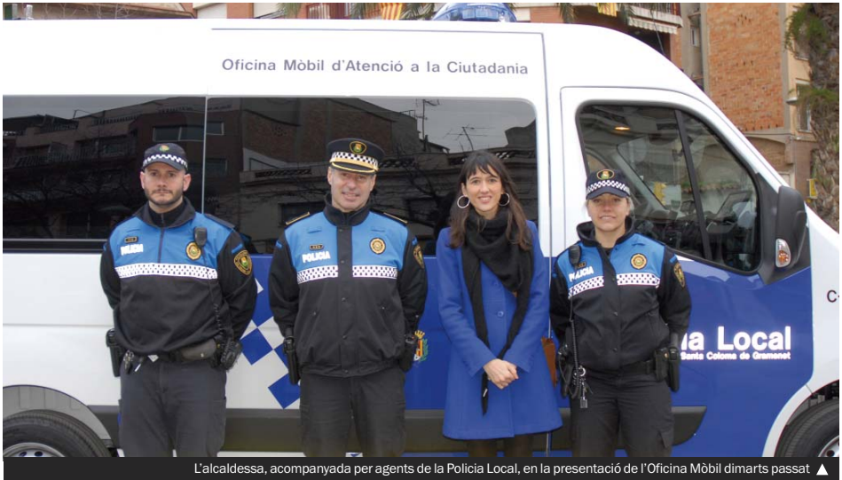
L'alcaldesa, acompanyada per agents de la Policia Local, en la presentació de l'Oficina Mòbil dimarts passat