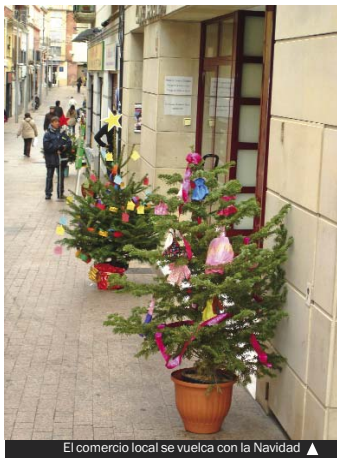
El comercio local se vuelca con la Navidad ▲

Las asociaciones de comerciantes, la Agrupació del Comerç i la Indústria (ACI), Fondo Comerç y los mercados municipales han comenzado su campaña navideña con diversas ofertas para atraer y fidelizar clientela. Los comercios de las calles del centro histórico se suman este fin de semana con actividades de ocio y participación que se alargarán hasta la vigilia de Reyes.