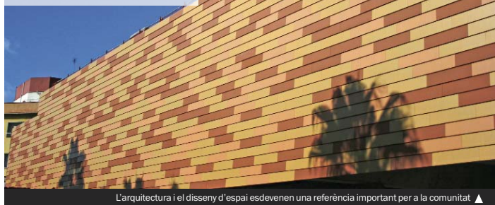
L'arquitectura i el disseny d'espai esdevenen una referència important per a la comunitat ▲