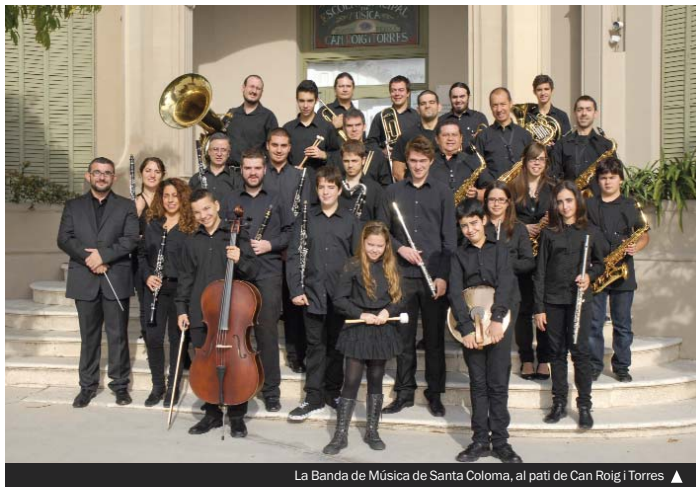
La Banda de Música de Santa Coloma, al pati de Can Roig i Torres ▲

L'Oficina d'Informació d'aquestes obres està situada al carrer de la Ballodina, 7 . L'horari és de dilluns a dimecres de 16.00 a 18.00 h i els divendres de 10.00 a 12.00 h. Més informació, al telèfon 93 462 40 37 (de dilluns a divendres de 9.00 a 13.00 h) i a través de l'adreça electrònica obrescentre@gramenet.cat .