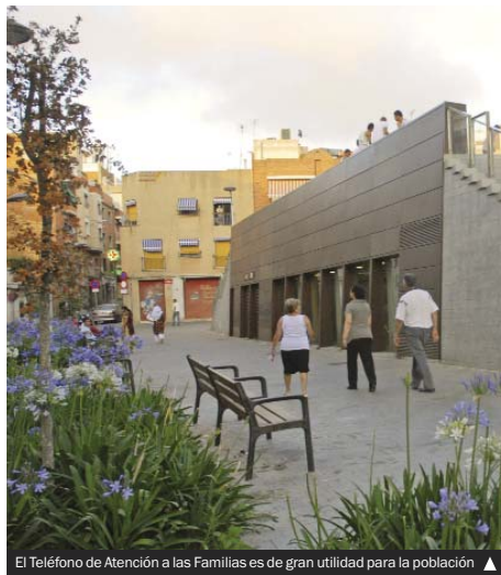
El Teléfono de Atención a las Familias es de gran utilidad para la población ▲

El Teléfono de Atención a las Familias funciona las 24 horas de los 365 días del año. En horario diurno (de 9.00 a 14.00), dos profesionales están al frente del servicio. El resto del tiempo funciona un contestador automático que recoge las peticiones para que sean atendidas al día siguiente. Las personas con discapacidad auditiva no se quedan fuera, ya que pueden