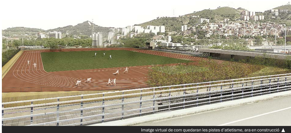
Imatge virtual de com quedaran les pistes d'atletisme, ara en construcció ▶

La pista tindrà 8 carrers i zones per a salts d'alçada i perxa i una recta per a salts de llargada i triple salt. A l'espai central, de gespa natural, hi haurà zones de llançament i, de manera perimetral a la pista, es preveu una zona d'escafament de tres metres d'amplada. A més de la pista i