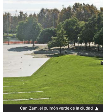
Can Zam, el pulmón verde de la ciudad ▲

El Ayuntamiento está trabajando en la adecuación temporal de los terrenos para la futura ampliación del parque. Se está actuando para uniformar las zonas con pendiente y prepararlas para la plantación de vegetación, que corresponde a la segunda fase del proyecto global de Can Zam. Para acabar de concretar las posibilidades de este gran espacio, a principios de año se creó una comisión de seguimiento ciudadano, integrada por diferentes entidades y asociaciones colomenses. Concejales y técnicos del Ayuntamiento y del Área Metropolitana de Barcelona, que es la administración propietaria de una gran parte del parque y la encargada de su mejora y manteni-