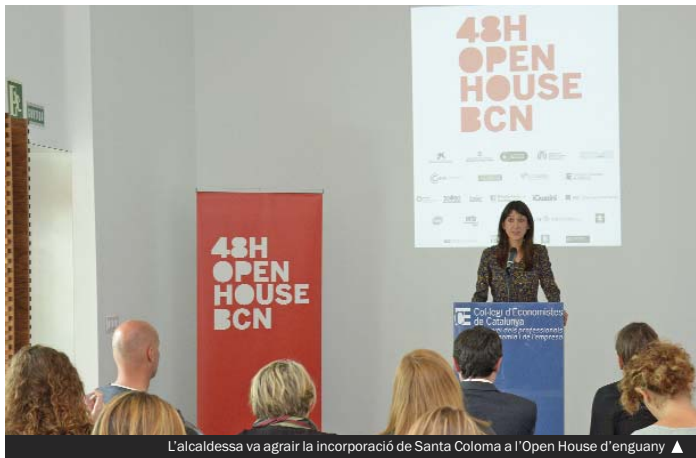
L'alcaldesa va agrair la incorporació de Santa Coloma a l'Open House d'enguany ▶

Open House és una iniciativa oberta a tot tipus de públics, iniciada a Londres l'any 1992, i que s'ha anat introduint en altres ciutats com Nova York (2002), Dublín (2005), Galway (2009), Tel-Aviv (2007) o Bar-