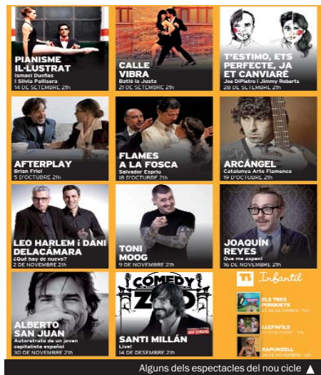
Alguns dels espectacles del nou cicle ▶

El Sagarra s'afegeix a l'Any Espriu, amb Flames a la fosca , de la companyia La Trilateral (18 d'octubre). No hi faltaran dramaturgs de la talla del nord-americà Neil LaBute ( La forma de las cosas , 4 d'octubre), de l'irlandès Brian Friel ( Afterplay , 5 d'octubre) o del rus Txèkhov ( Sobre els danys del tabac , 26 d'octubre).