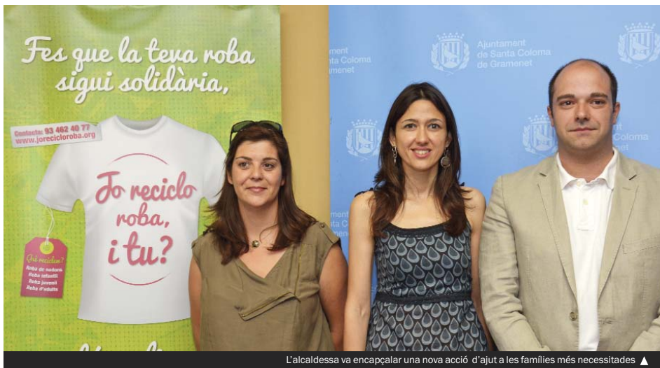
L'alcaldesa va encapçalat una nova acció d'ajut a les famílies més necessitades ▶