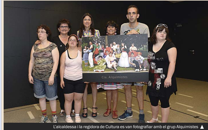
L'alcalde i la regidora de Cultura es van fotografiar amb el grup Alquimistes ▲

► Aquest cap de setmana acaben les representacions de la Fira Internacional de Teatre Integratiu (FITI) que des del dia 6 de juliol se celebra a Santa Coloma. Amb el lema "Jo, tu i tothom", la FITI mostra el treball creatiu i professional d'onze companyies formades per persones amb algun tipus de discapacitat. Es tracta d'un esdeveniment que dona l'oportunitat de viure l'experiència artística a persones amb diversitat funcional. A més de les funcions teatrals, avui, 19 de juliol, hi haurà tallers gratuïts sobre expressió corporal i art dramàtic. Totes les funcions se celebren al Teatre Sagarra. Aquest és el calendari de representacions: