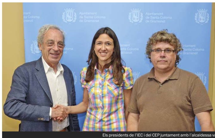
Els presidents de l'IEC i del CEP juntament amb l'alcaldesa van celebrar la creació del Consorci del poblat ibèric ▲