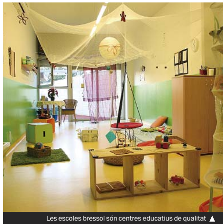
Les escoles bressol són centres educatius de qualitat ▶

L'oferta pública per al proper curs escolar és de 675 places, de les quals 243 promocionen des del curs anterior. El total de matrícules ha estat fins ara de 584 i en llista d'espera en resten 125. En aquests moments, hi ha 91 places vacants. Els resultats del procés de preinscripció i matrícula planteja un panorama diferent. Si bé en algunes escoles és més gran la demanda que l'oferta, en d'altres la situació és la contrària. Hi ha places vacants a tots els grups d'edat. Per aquest motiu, el Servei d'Educació obre de nou la preinscripció, fora de termini, en aquelles escoles i grups que tinguin vacants. A les famílies que estan en llista d'espera se'ls oferirà una alternativa en algun centre. Les famílies que vulguin informar-se'n o sol·licitar una plaça han