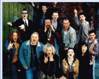
Lugar: Biblioteca Singuerlín-Salvador Cabré (plaza de la Sagrada Familia, s/n)

Hoy, día 21 (20.00), el Cine Club Imatge, con el patrocinio del Ayuntamiento, proyectará The Commitments , película de 1991 de Alan Parker, director de otras obras tan conocidas como El expreso de medianoche , Arde Mississippi , Fama o Pink Floyd The Wall . En este caso, se explica la historia de los componentes de un grupo musical de un barrio obrero de Dublín enamorados del soul. Parker utiliza actores no profesionales para conseguir una historia fresca, divertida y sincera. Entrada libre.