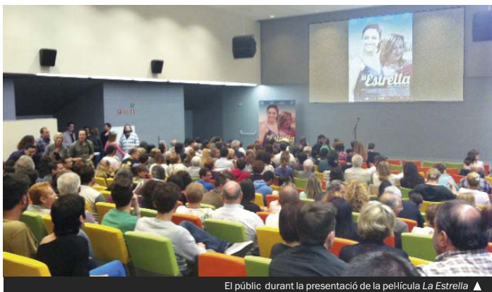
El públic durant la presentació de la pel·lícula La Estrella ▲

▶ Este fin de semana empieza en el Camp Municipal de Can Zam 1el Torneo de Fútbol Base CD Arrabal-CF Calaf de Gramenet en las categorías juvenil, cadete, infantil, alevín, benjamín, prebenjamín y escuela. Además del club local, los equipos son Santa Perpètua, Turó de la Peira, La Llàntia, PB Barcino, Veteranos de Catalunya, Bonaire, Montornès, Rubí, Can Rull, Cirera, Alzamora, Mercantil, Vilanova del Vallès, Sant Quirze del Vallès, Gavà Mar, Pla d'en Boet, Juventud 25 Septiembre, Cardedeu, PB Ramon Llorens y Barceloneta.