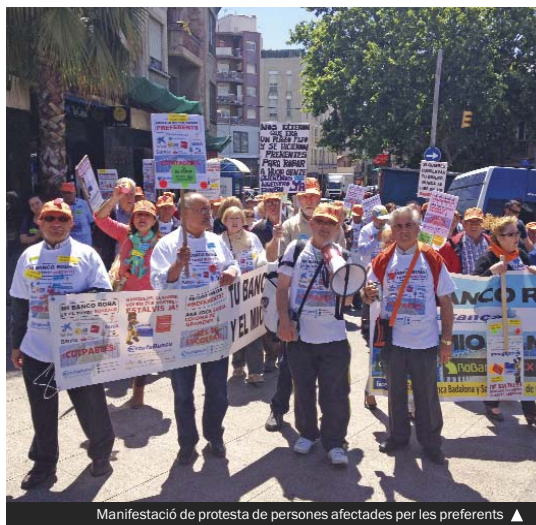
Manifestació de protesta de persones afectades per les preferents ▲

L'Ajuntament inicia també la creació d'un registre de persones afectades a la ciutat per les preferents a fi de tenir quantificat el nombre d'afectats i les entitats bancàries implicades i, a partir d'aquí, poder oferir orientació jurídica, informar de les accions o gestions que es portin a terme de manera indivi-