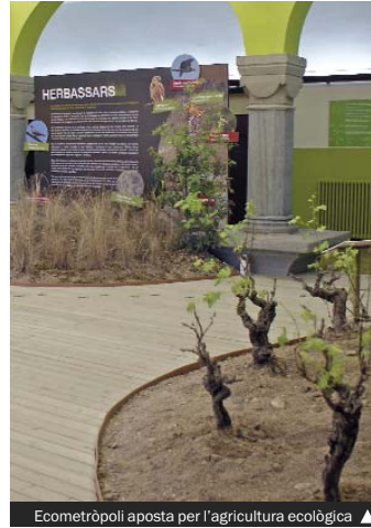
Ecometròpoli aposta per l'agricultura ecològica ▲

En aquest sentit, diumenge, 2 de juny (d'11.00 a 12.30), hi haurà un xerrada taller. Amb el títol "Renova la teva energia", professionals del Centre parlaran del malbaratament de l'energia elèctrica