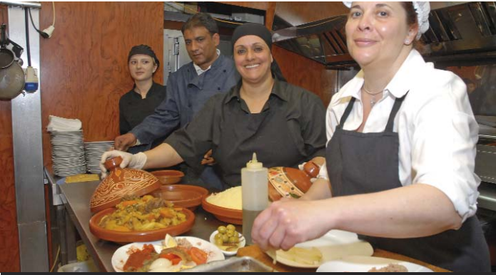
La fira ofereix l'oportunitat de tastar plats d'arreu del món ▲