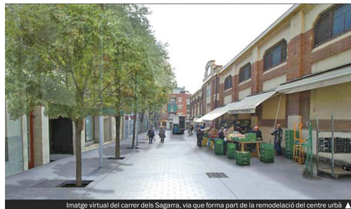
Imatge virtual del carrer dels Sagarra, via que forma part de la remodelació del centre urbà ▲