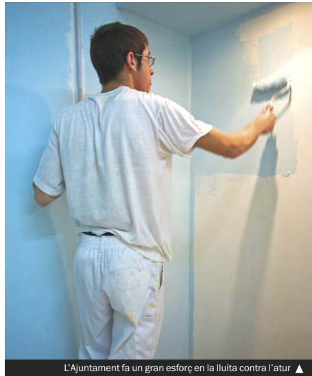
L'Ajuntament fa un gran esforç en la lluita contra l'atur

Mitjançant el Pla d'ocupació es contractaran persones i es dotaran de recursos dues línies d'actuació. D'una banda, es demanaran operaris i operàries per realitzar petites tasques de manteniment, reparacions o adaptació de les llars de les persones grans amb mobilitat reduïda i que no tenen recursos per fer-se càrrec d'aquests treballs. A més del pagament dels sous, es destinarà una part del pressupost a la compra de material i d'eines. De l'altra, es cercarà un grup de treballadors i treballadores qualificats que faran una tasca més d'acompanyament, especialment adreçada a les persones grans que viuen soles, per tal d'informar-les dels recursos als quals poden accedir, assessorar-les i acompanyar-les en les seves tasques diàries.