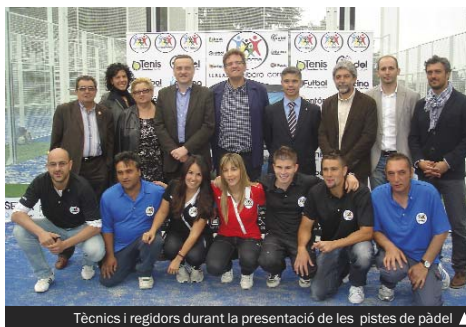
Tècnics i regidors durant la presentació de les pistes de pàdel ▲