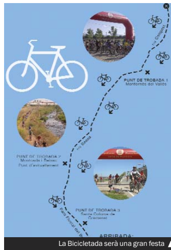
La Bicicletada serà una gran festa ▲

► Organitzada per la Diputació de Barcelona, amb la col·laboració de l'Ajuntament, diumenge, 5 de maig, tindrà lloc la XI Bicicletada Popular per la riba recuperada del riu Besòs. La sortida serà des del parc firal de Granollers (9.30). Hi haurà un recorregut de 24 quilòmetres, que acabarà a Sant Adrià de Besòs, i la participació és oberta a tothom. L'objectiu és fomentar la pràctica de l'esport en un espai natural atractiu i de qualitat amb l'aigua com a protagonista. Els participants podran iniciar la cursa en la sortida o bé incorporar-s'hi des dels punts de trobada habilitats a Montornès del Vallès, Montcada i Reixach i Santa Coloma de Gramenet (Can Zam Nord, de 10.45 a 12.45). L'organització recomana l'ús del casc, guants i d'una bicicleta BTT. Hi donen suport el Consorci per la Defensa del Riu del Besòs i la Federació Catalana de Ciclisme.