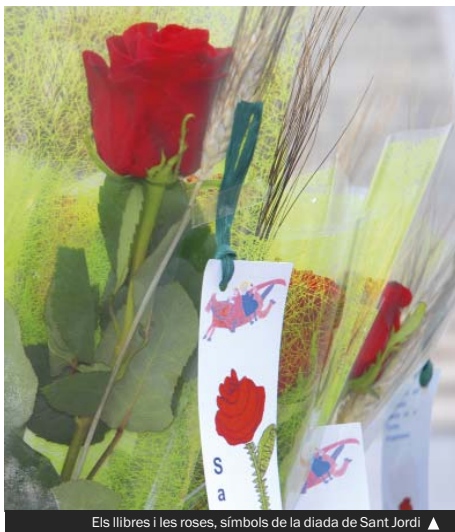
Els llibres i les roses, símbols de la diada de Sant Jordi ▶

Les tres biblioteques i el Mercat del Singuerlín instal·la-