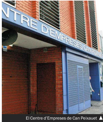
El Centre d'Empreses de Can Peixauet ▶

El model de Reempresa es basa en la compra o lloguer d'actius i fons de comerç d'una empresa per part d'una o més persones amb l'objectiu de continuar amb el negoci original i fer-lo créixer; alhora, és una manera d'evitar els tràmits de crear una empresa nova. Es tracta d'un mecanisme professional, inspirat en el model europeu de reemprenedoria, pel qual un o més reemprenedors accedeixen a la propietat d'una empresa d'altres persones, en funcionament, per impulsar-la sense haver de passar per la fase de crear-la.