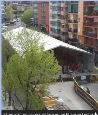
El mercat provisional estarà enllestit aquest estiu ▲

► El 4 d'abril es va iniciar el muntatge de l'estructura provisional i, quan les obres acabin, previsiblement al juliol, s'hi farà el trasllat dels paradistes. L'objectiu del mercat provisional és que els paradistes del Mercat Sagarra puguin continuar amb la seva activitat durant el període que durin les obres de reforma de l'antic edifici, uns 18 mesos aproximadament.