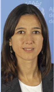
Núria Parlon Gil Alcaldesa de Santa Coloma de Gramenet

El 8 de març ens ofereix un moment per a la reflexió. La lluita contra la desigualtat per motiu de sexe, contra la violència masclista o l'equiparació salarial de dones i homes té en aquesta jornada un protagonisme que no s'hauria d'acabar l'endemà. La igualtat és un valor i la lluita per la seva consecució ha de ser continuada, sense baixar la guàrdia.