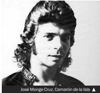
José Monge Cruz, Camarón de la Isla ▲